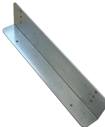
Abbildung 2: Montagehalterung