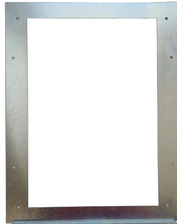
Abbildung 1: Montagehilfe