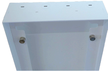
Abbildung 3: Einbaudose oben