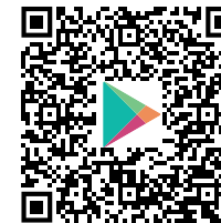
SENTRON Configuration App