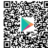
SENTRON Configuration App